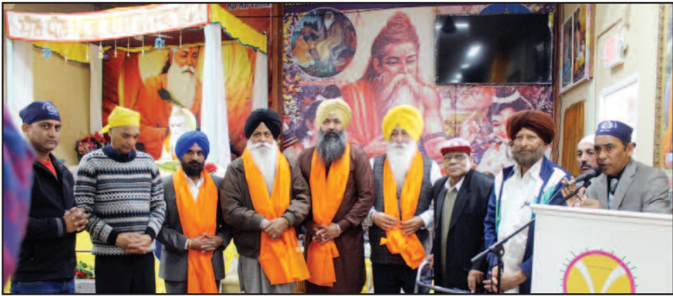
ਮਹਾਂਰਿਸ਼ੀ ਵਾਲਮੀਕਿ ਟੈਂਪਲ ਦਾ ਤੀਸਰਾ ਸਥਾਪਨਾ ਦਿਵਸ ਮਨਾਇਆ ਗਿਆ। (ਰਿਪੋਰਟ ਦੇਖੋ ਸਫਾ 4 'ਤੇ ਅਤੇ ਤਸਵੀਰਾਂ ਦੇਖੋ ਸਫਾ 12-13 'ਤੇ)

ਮੁੱਖ ਸੰਪਾਦਕ : ਪ੍ਰੇਮ ਕੁਮਾਰ ਚੰਬਰ ਸੰਪਰਕ : 916-947-8920 ਫੈਕਸ : 916-238-1393 E-mail : deshdoaba@yahoo.com ਸੰਪਾਦਕ : ਤਰਸੇਮ ਜਲੰਧਰੀ