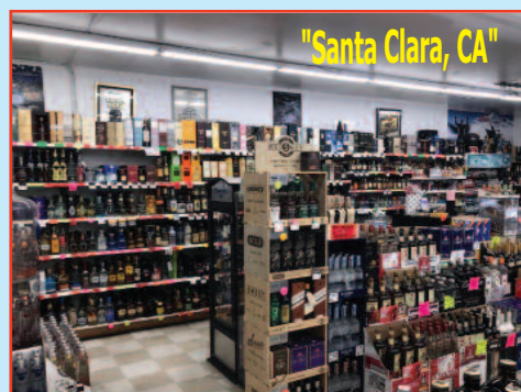
"$649,000 High Volume Liquor Store", "Gross $90k+/Month"