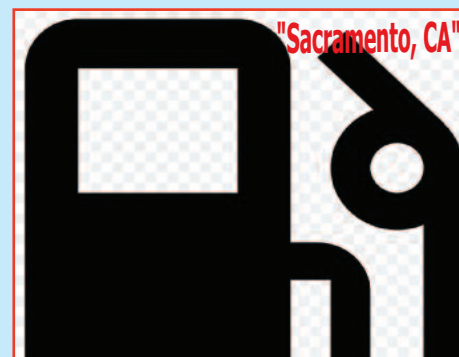
"$4.4 Million Gas Station with Real Estate", "High Volume"

CALL US FOR FREE CONSULTATION ABOUT SELLING YOUR GAS STATION OR HOTEL. WE CAN ALSO GIVE YOU OUR EXPERT ADVISE ON VALUE OF YOUR GAS STATION OR ANY COMMERCIAL PROPERTY.