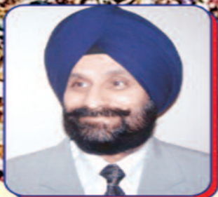
ਮੁੱਖ ਬੁਲਾਰੇ ਡਾ. ਵਰਿਆਮ ਸਿੰਘ ਸੰਧੂ