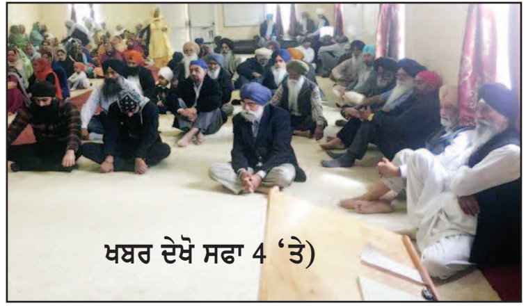
ਖਬਰ ਦੇਖੋ ਸਫਾ 4 'ਤੇ)