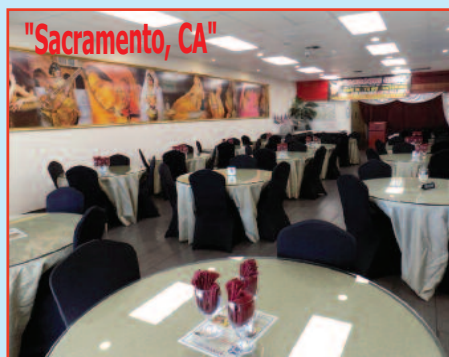
"$134,000 Indian Restaurant with beer and wine license"

SPECIALISE IN BANK REPO APARTMENTS, COMMERCIAL PROPERTIES, GAS STATIONS, HOTELS AND AGRICULTURAL LAND