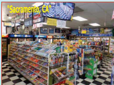
"$599,900 High volume liquor store", "Gross $100k+/Month"